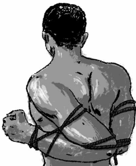
Ligotage lors des arrestations