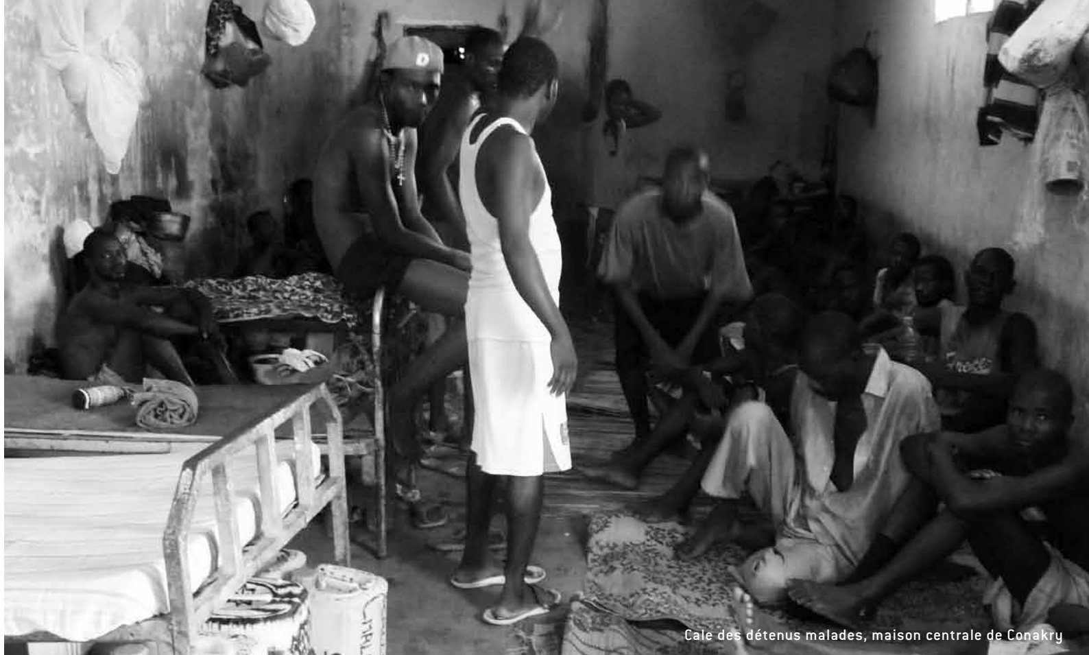
Cale des détenus malades, maison centrale de Conakry