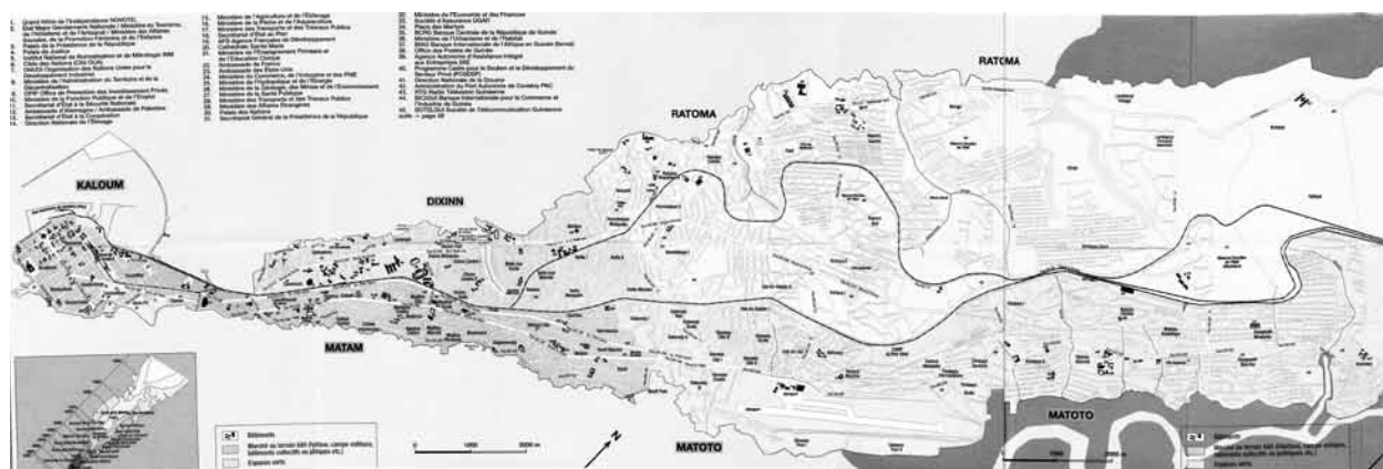
Carte de Conakry

Si toutes les parties du territoire guinéen n'ont pu être explorées, notamment celle de la Guinée forestière, l'usage de la torture décrit dans ce rapport semble pouvoir s'appliquer à l'ensemble du pays. Il serait extrêmement surprenant que la pratique banalisée de la torture, ici répertoriée, ainsi que ses causes profondes et anciennes, soient absentes des autres zones du pays.