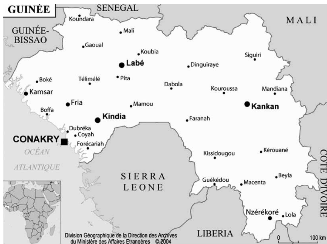
Carte de Guinée