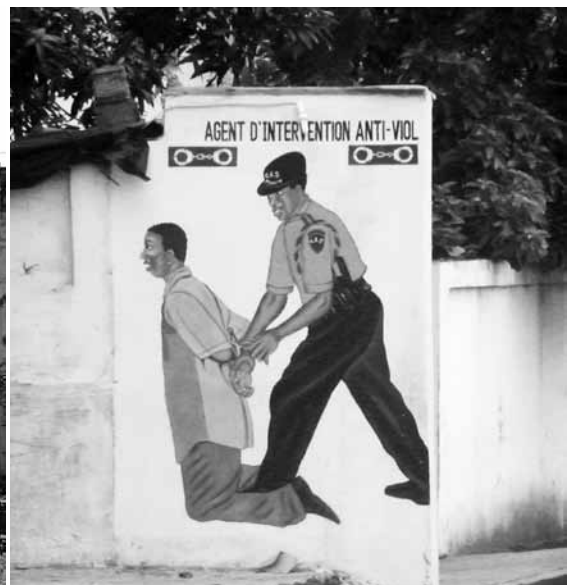
Dessin mural à Conakry