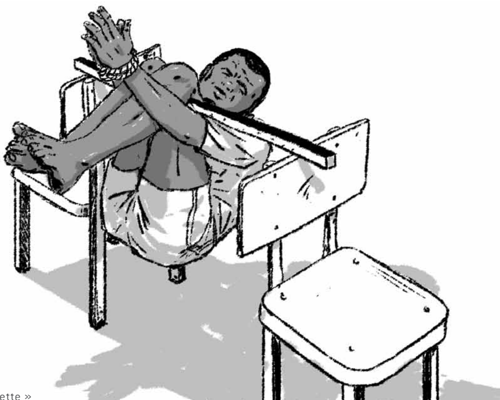
Position de la « brochette »

« J'avais quatre blessures par balles : une à la poitrine, une à la main gauche, une à la main droite et une au bras droit. Alors que j'étais attaché, des policiers venaient me gifler, me frapper avec leurs pistolets. Le commandant et ses hommes me disaient : "On va te couper la main gauche". C'était celle qui semblait être la plus blessée. Au cours de cette journée, la Radio Télévision Guinéenne est venue me filmer, avec mes camarades. Nous avons été présentés comme des "bandits", accusés de vol à main armée ». Amené à l'hôpital mais n'ayant pu recevoir des soins appropriés en raison, selon ses dires, de l'opposition du commandant, il a été finalement amputé de la main et de l'avant-bras gauche, par des militaires.