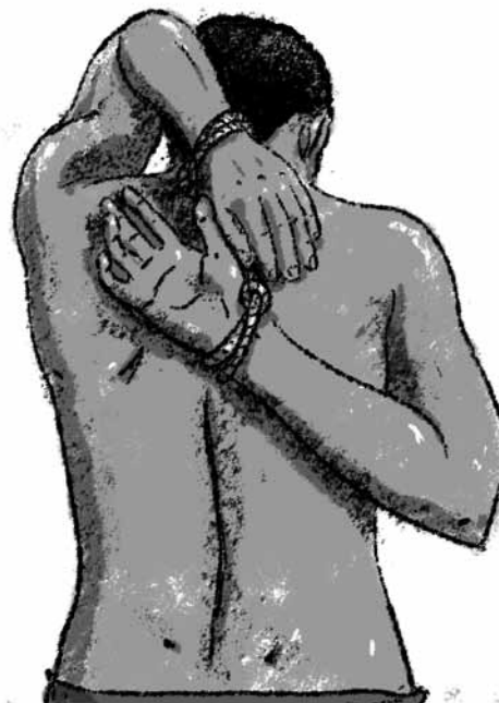
Position à la « chinoise »