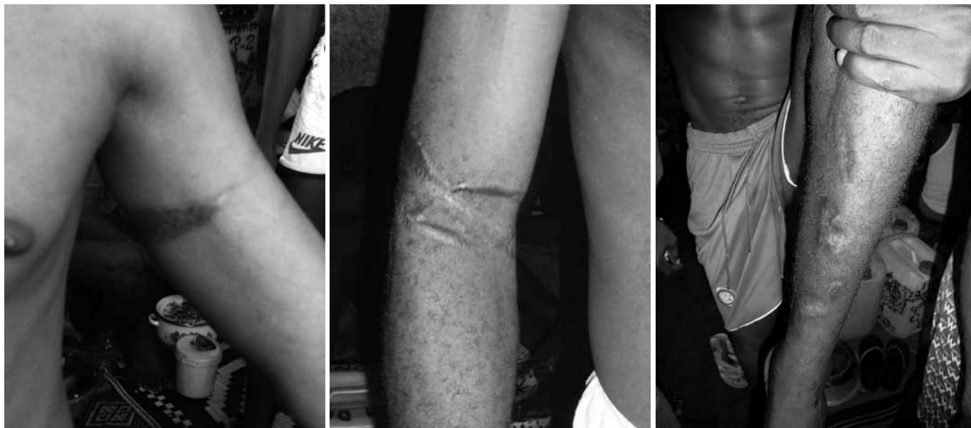
Cicatrices d'actes de torture sur des prisonniers de droit commun.

Plusieurs escadrons mobiles de la gendarmerie 41 , à Conakry comme dans d'autres villes de l'intérieur du pays, ont été cités à plusieurs reprises par des victimes pour avoir utilisé la torture contre des présumés assassins, voleurs et autres suspects. Ces violences se sont produites lors des arrestations et gardes à vue dans les casernes de gendarmerie.